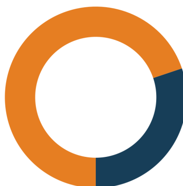
Koop / huur